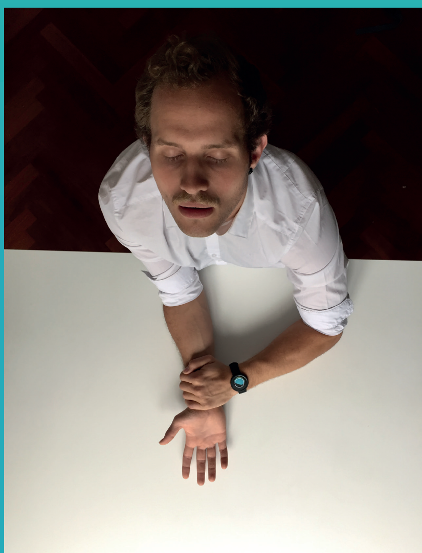
Ein Nutzer während des Initialisierungsritus